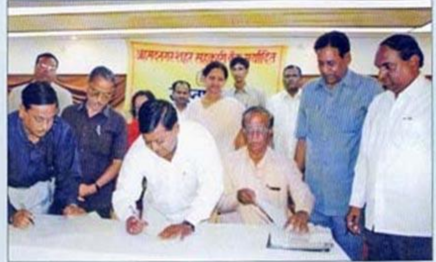
वॅकेचे पदाधिकारी व कर्मचारी युनियन पदाधिकारी वेतन विषयक करारावर सह्या करतांना.