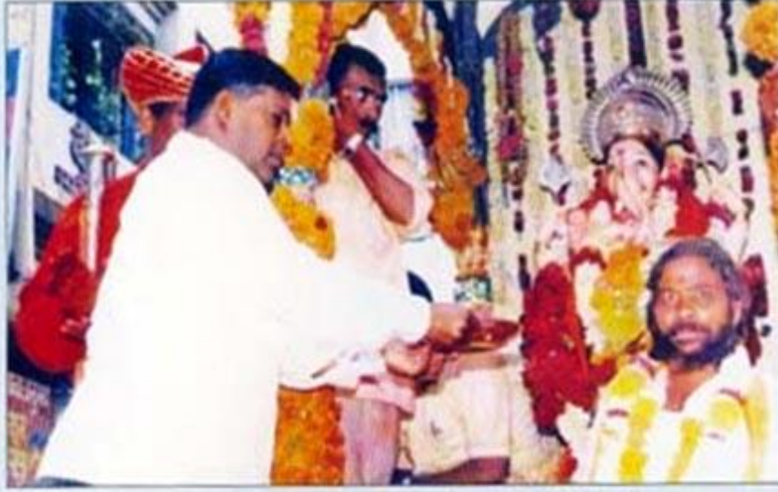
ग्रामदैवत विशाल गणपती विसर्जन मिरवणूकीचे वॅकेतर्फे स्वागत