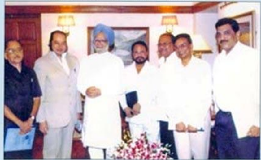
सहकारी बँकांच्या शिष्टमंडळाची प्राप्तीकर संदर्भात पंतप्रधान डॉ. मनमोहन सिंग यांचेशी नवी दिल्ली येथे झालेली चर्चा.