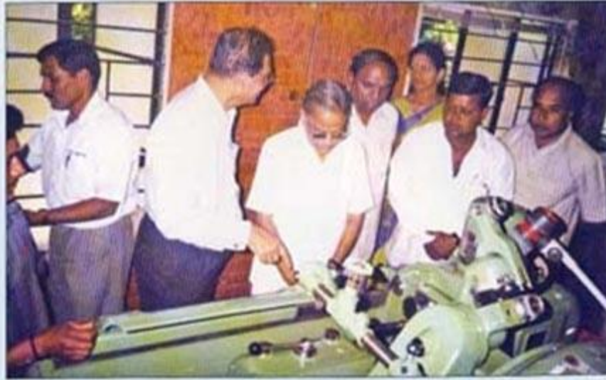
साईज कंट्रोल गेजेस अँड टूल्स प्रा.लि. या एम.आय.डी.सी. तील कंपनीने नव्याने कार्यान्वित केलेल्या मशिनरीची विधीवत पूजा करतांना.